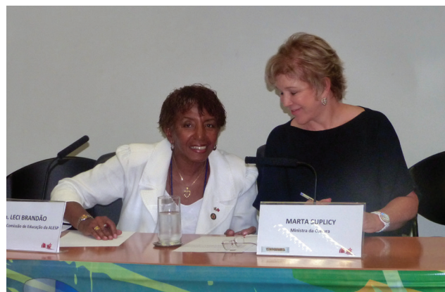
Leci preside audiência sobre Vale Cultura com a presença da ministra Marta Suplicy

Como presidente da Comissão de Educação e Cultura, a deputada Leci Brandão recebeu, em audiências públicas, os ministros Aloizio Mercadante (Educação) e Marta Suplicy (Cultura). Mercadante apresentou à comissão os índices relacionados à inclusão de jovens no ensino superior, os investimentos que vêm sendo feitos pelo Governo Federal no setor e defendeu