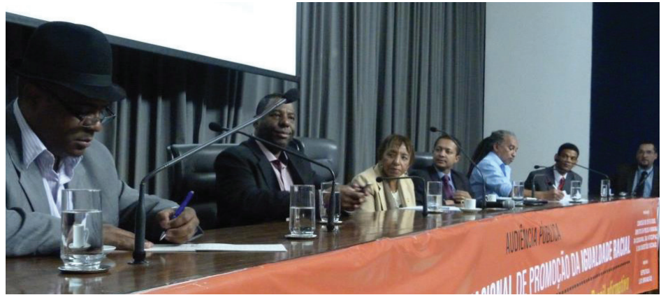
Leci preside audiência sobre 3ª Conapir

ção do secretário da Promoção da Igualdade Racial da prefeitura de SP, Netinho de Paula, que citou os avanços do país em relação à promoção da igualdade, mas disse também que falta incluir o assunto no Orçamento. “Temos de lutar contra ações que criminalizam nossa cultura, nossa religião e exterminam nossa gente”.